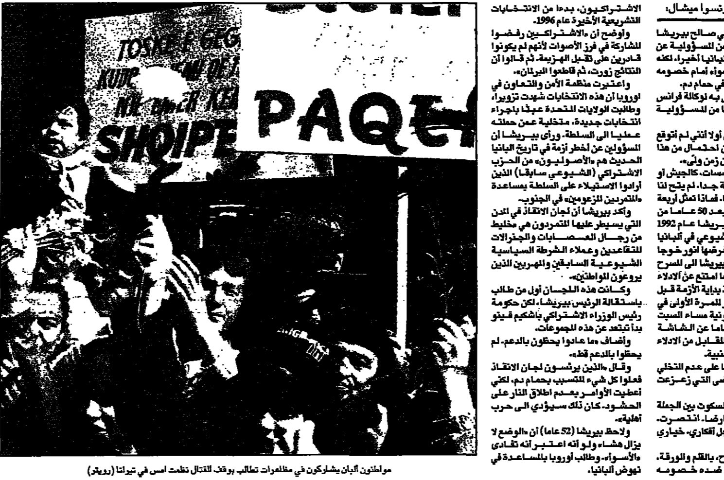
مواطنون البان يشاركون في مظاهرة تطالب بوقف القتال نقلت اسم في تيرانا